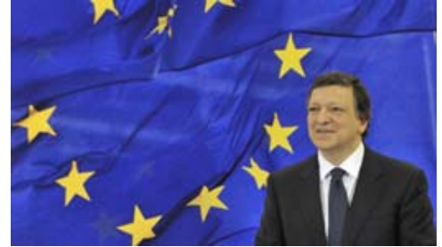
Barroso.

Olli Rehn, hasta ahora comisario de Ampliación, también ha sido criticado por su falta de preparación para hacerse cargo de la importante cartera de Asuntos Económicos y Monetarios.